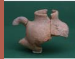
Εικ. 3. Κεχρινιά Βάλτου. Χειροποίητη κεραμική από το θολωτό τάφο.