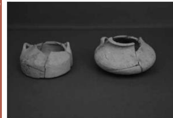
Εικ. 7. Κεχρινιά. Θολωτός τάφος. Πήλινα αλάβαστρα.